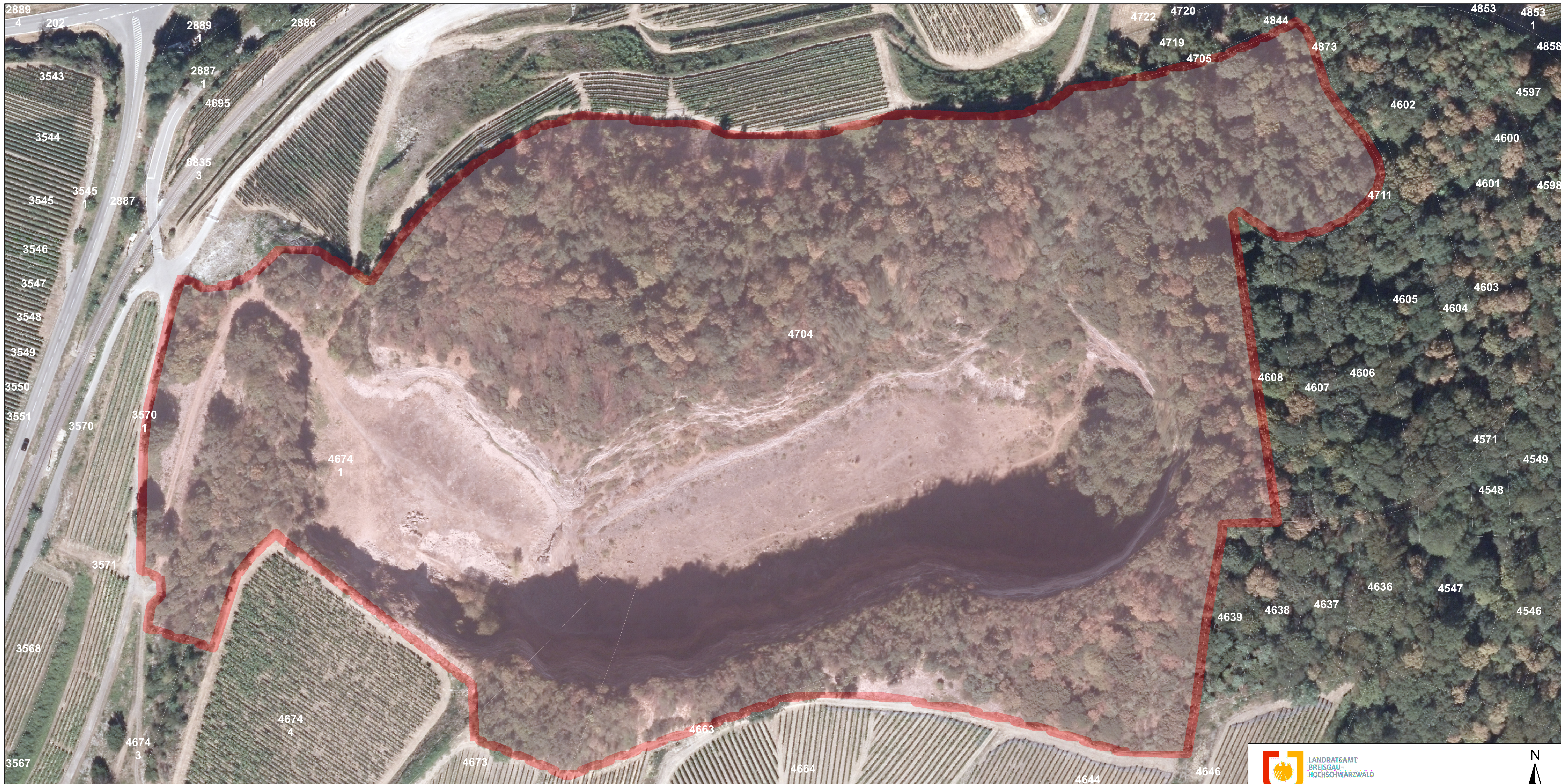
Übersichtskarte Niederrotweil, Vogtsburg im Kaiserstuhl 1:5.000